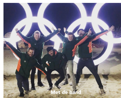
Met de band